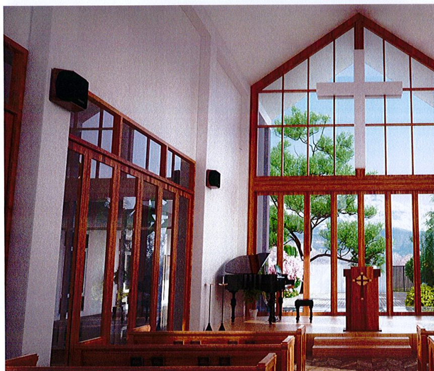
Arkitekttegninger: Slik vil den ferdig Sjømannskirken i Pattaya se ut.